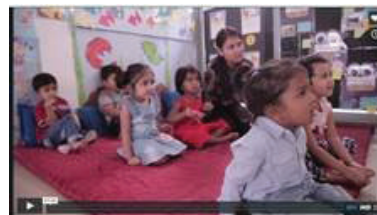
PYP Review 2016

El equipo de desarrollo del PEP está utilizando las nociones de “el alumno”, “el aprendizaje y la enseñanza” y “la comunidad de aprendizaje” como marcos en los que sustenta sus reflexiones respecto al PEP, así como su revisión.